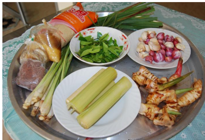
ภาพประกอบที่ 3 วัตถุประสงค์ในการผลิตน้ำบูดูข้าวยา

1) วัตถุประสงค์ ในการผลิต ได้แก่ ปลาหมัก ตะไคร้ ใบมะกรูด มะขามเปียก หอมแดง กระเทียม และข่า วัตถุประสงค์ดังกล่าวหาซื้อในชุมชนและตลาดสด อำเภอหาดใหญ่ ความถี่ใน การจัดซื้อ 1 - 2 ครั้งต่อเดือน