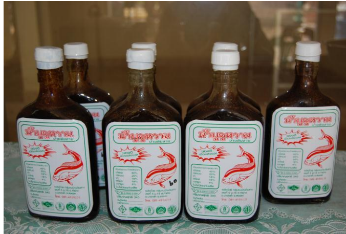
ภาพประกอบที่ 4 ผลิตภัณฑ์น้ำบูดู

1.6 การเงินและการทำบัญชี เงินทุนของกลุ่มได้มาจากการร่วมทุนของสมาชิก การเงินมีสภาพคล่อง การบัญชีมีระบบการบันทึกบัญชีที่เป็นระบบ ภายใต้การดูแลของโครงการพลิกฟื้นธุรกิจสถาบันเกษตรกรผ่านกลไกทางบัญชี กรมตรวจบัญชีสหกรณ์ สำนักส่งเสริมพัฒนาการบัญชีและถ่ายทอดเทคโนโลยี บัญชีที่ทางกลุ่มจัดทำ ได้แก่ สมุดบันทึกรายการทั่วไป ทะเบียนคุมสินค้า สมุดบัญชีแยกประเภททั่วไป และสมุดบัญชีย่อยลูกหนี้